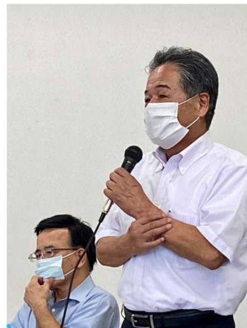
三島監事により連盟監査報告