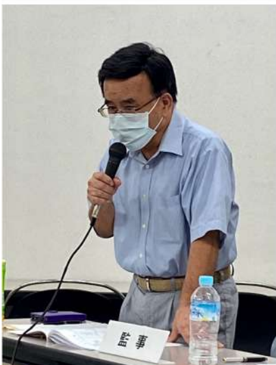
植莚監事により監査報告