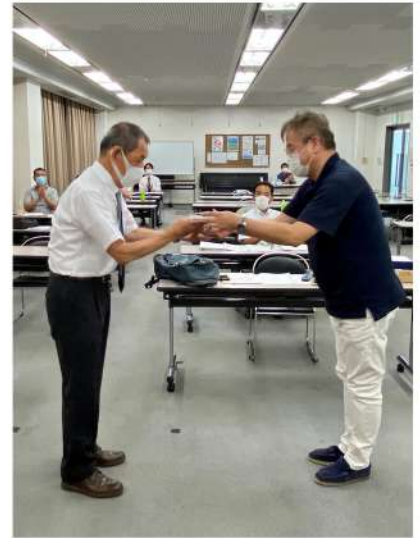
学術理事より記念品贈呈