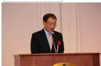
熊本県副知事 田嶋 徹様