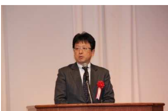
熊本市長 大西一史様