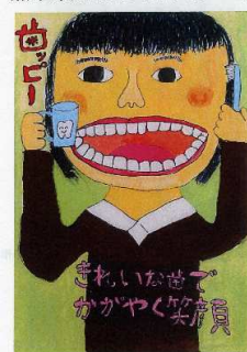
熊本県知事賞 [ポスターの部]

今年は6月4日が日曜日だという事で、この日熊本県内の各地で歯の健康習慣のイベントが開催されました。 昨年の引き続き私は県歯科医師会から来賓での案内が届き、熊本県歯科医師会主催の「歯の祭典」に出席してきました。 例年の事ながら、子供たちの絵画や習字の上手さには感心させられます。 また8020の表彰では対象の高齢者のお元気さに、やっぱり歯は大事なんだなあ、と毎回納得させられます。 各支部のみなさん、イベント参加お疲れ様でした。 八代は1週間後だとか聞きましたが、いずれにしても皆さんのそうした活動が技工士の存在を市民に知ってもらおうきっかけになるとと思います。